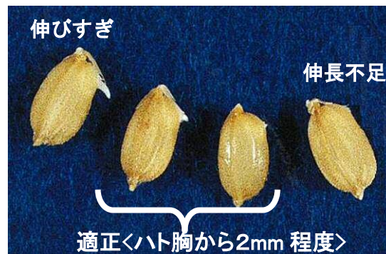
写真 催芽完了の目安

・催芽を均一にするため、種籾は袋に詰めすぎないようにし、均一に広げ、7～8時間に1回の割合で籾袋を反転させましょう。